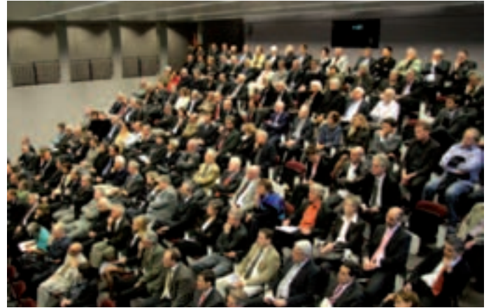
Das Publikum erschien zahlreich zur Eröffnungsfeier in den Räumlichkeiten der Berner Fachhochschule in Burgdorf.