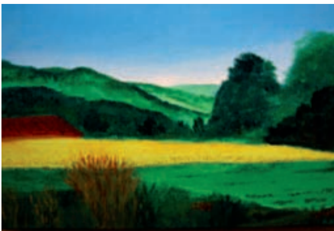
Die Bilder und Skulpturenausstellung von Ärztinnen und Ärzten rundeten die Veranstaltung ab. Hier: R. Grüring «Sonnenblumen in der Ariège».