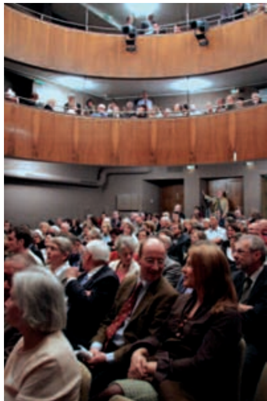
Die Spannung steigt im voll besetzten Casino-Theater Burgdorf.

Jules Romains gilt als Begründer des Unanimismus, einer philosophischen Bewegung, welche die mystische Idee einer Kollektivseele propagierte. Der Unanimismus betrachtete Menschen nicht als Individuen, sondern als Teil einer Gemeinschaft im Sinn einer beseelten Einheit (unanime). In Knock führt Romains die Idee des Unanimismus ins Absurde.