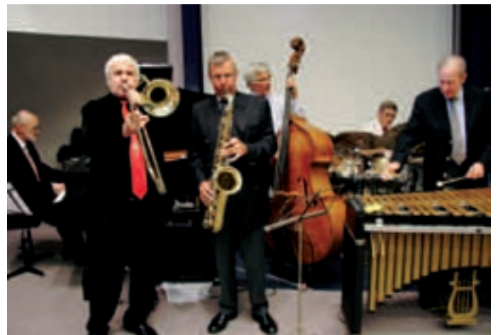
Verschiedene musikalische Darbietungen von musizierenden Ärztinnen und Ärzten untermalten die Aktivitäten am Eröffnungstag.