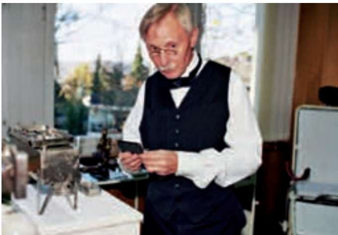
Eine Ausstellung von Arztpraxen aus den Jahren 1809, und 1909 sowie ein «Health Center» des Jahres 2109 informierte die Bevölkerung über die Entwicklungen in der Medizin. Die Abbildung zeigt eine Arztpraxis des Jahres 1909.