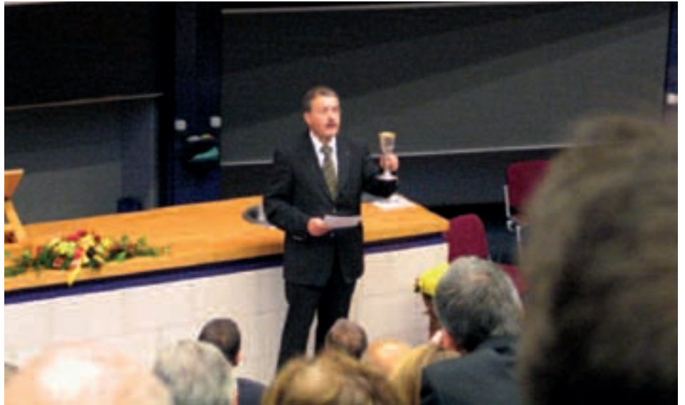
Bild: Edgar Höfs, Praxisfotograph; Praxis für Histopathologie, Dr. med. J. Janzen, MPhil